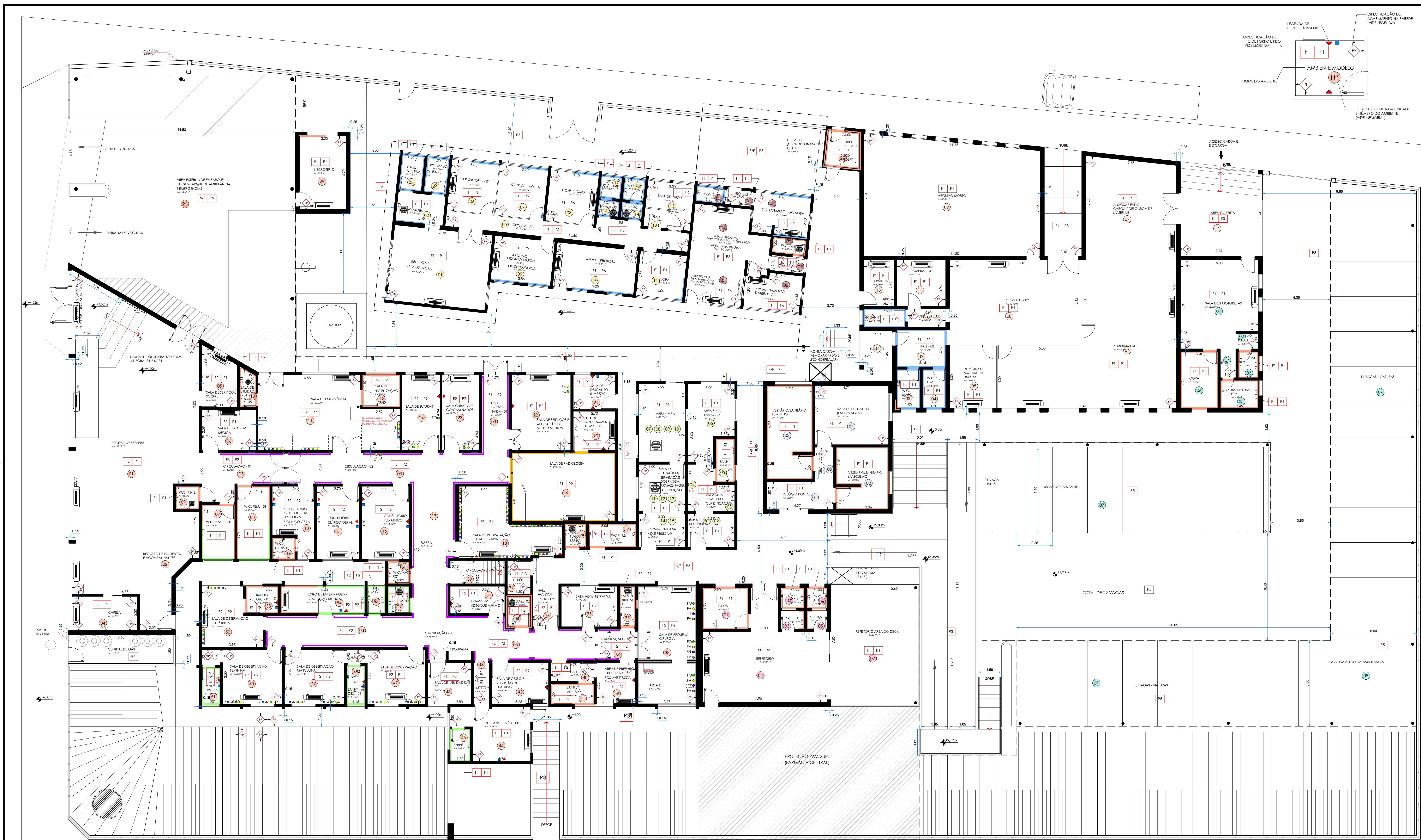
PLANTA - MATERIAIS - PAVIMENTO TÉRREO Esc.: 1/100